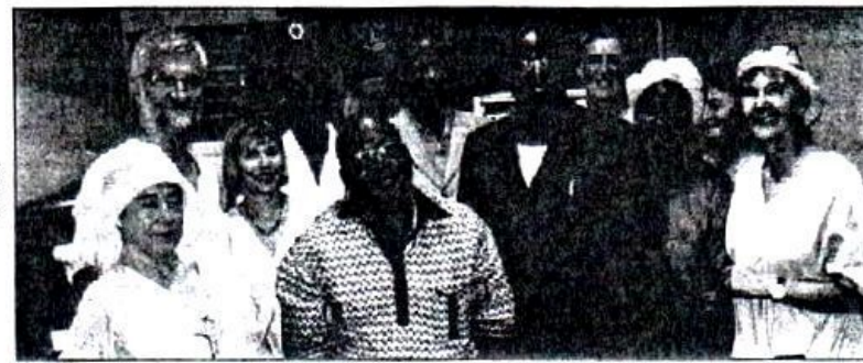
La délégation de Ouaga Doyen et l'équipe soignante de l'association Téo-Tourainé ont immortalisé cet événement