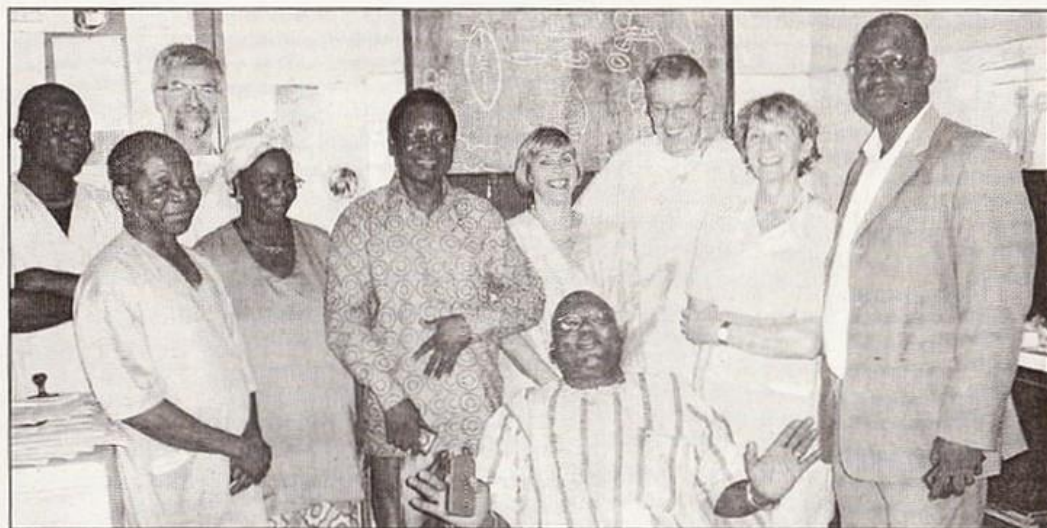
Médecins et lions ont posé pour la postérité