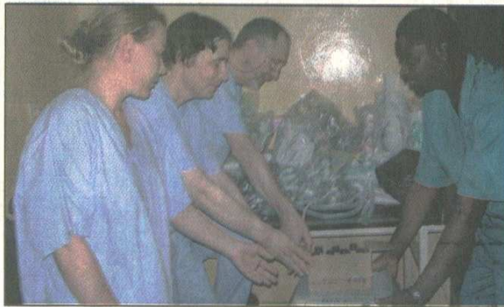
Une remise symbolique du matériel bio-médical aux responsables des structures bénéficiaires

L'ONG Tour Téo Touraine, puisqu'il s'agit bien d'elle, s'occupe des questions de santé, notamment sur le continent noir. Elle a répondu favorablement à cette doléance. Dans ce contexte, il est de coutume pour cette ONG humanitaire d'effectuer chaque année des missions médicales au Burkina. A chaque passage, les amis du Lions Club Ouagadougou Doyen apportent non seulement du